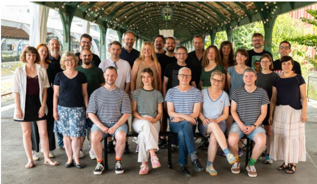
Gruppenfoto Sommerakademie 2024

Bitte berücksichtigen Sie bei Verwendung der Bilder die Bildunterschriften und das Copyright .